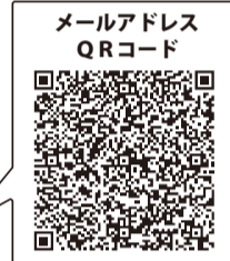
メールアドレス QRコード

参加ご希望の方は、代表者名・会社名、住所、電話番号、 Eメールをご記入の上、電話・FAXまたはEメールでお申込みください。