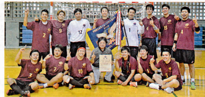
男子優勝の宜野湾市