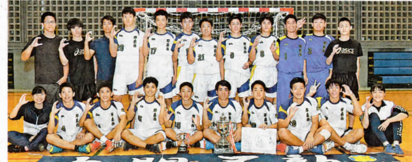
男子優勝の那覇西